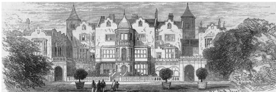
Holland House, Kensington, 2. a metade do século XIX. The Illustrated London News , 60.1712 (29 June 1872): 629